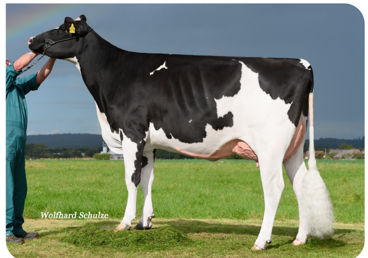
Adia (p. Adlon P)