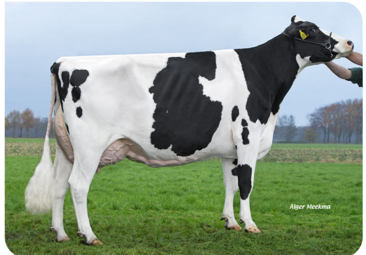
Big Elsie 7 (VG 89) Mère de Macht