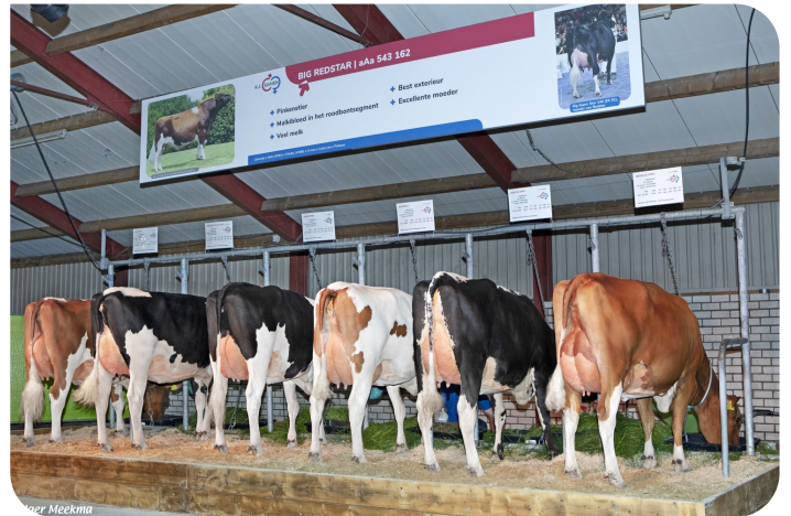
Groupe de Fille Big Redstar, Grasdag 2023 Grashoek (NL)