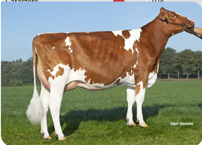
Angels Holdi 563 (p. Redstar) Prop.: Angels Holsteins, Meijel (NL)