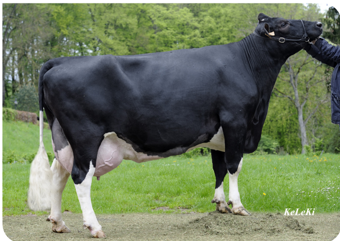
Valor Kiralle 853 (EX 90) (grand-mère de Bisor)