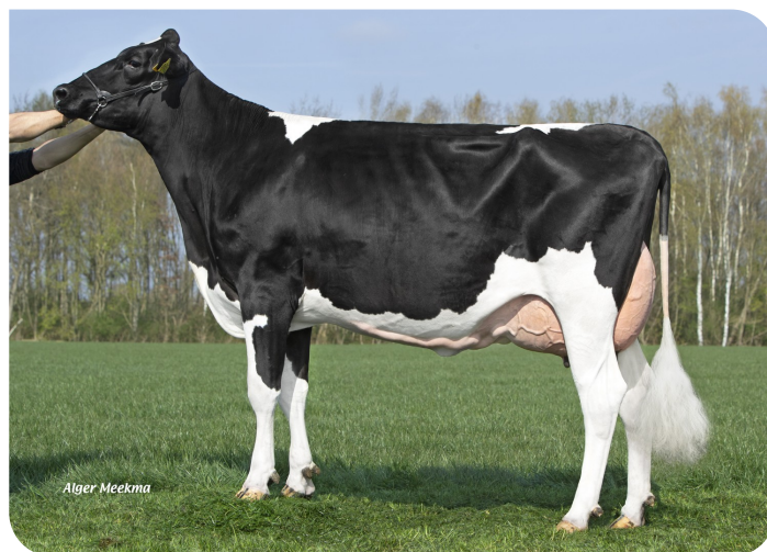
Grashoek Venetie 17 (p. Bisor)

Prop.: Fok- en melkveebedrijf K.I. Samen B.V., Grashoek (NL)