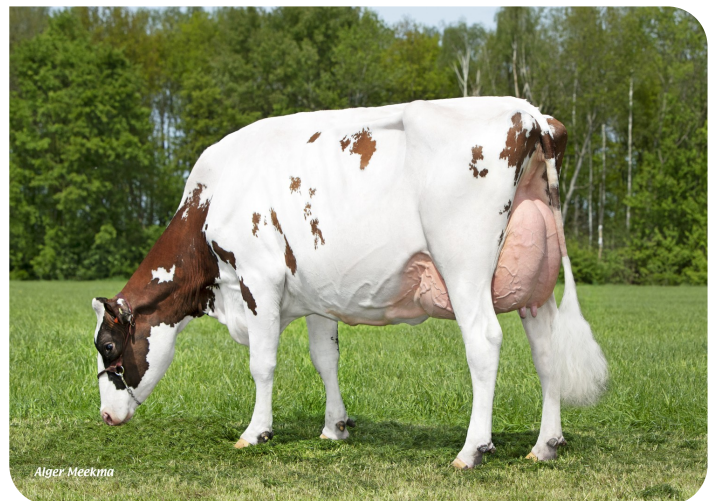
Grashoek Anna-Jacoba 13 (p. Dex) Prop.: Fok- en melkveebedrijf K.I. SAMEN B.V., Grashoek (NL)