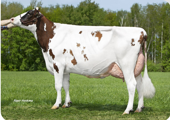
Grashoek Anna-Jacoba 13 (p. Dex) Prop.: Fok- en melkveebedrijf K.I. SAMEN B.V., Grashoek (NL)