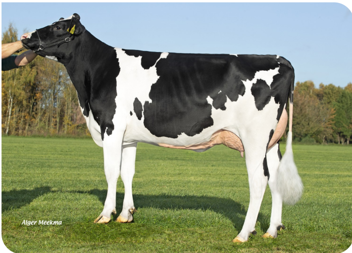
Grashoek Nordika 23 (VG 87)(p. Dex) Prop.: Fok- en melkveebedrijf K.I. SAMEN B.V., Grashoek (NL)