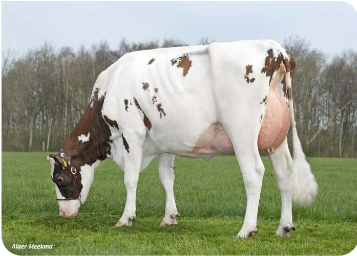
Grashoek Anna Jacoba 13 (p. Dex) Prop.: Fok- en melkveebedrijf K.I. SAMEN B.V., Grashoek (NL)