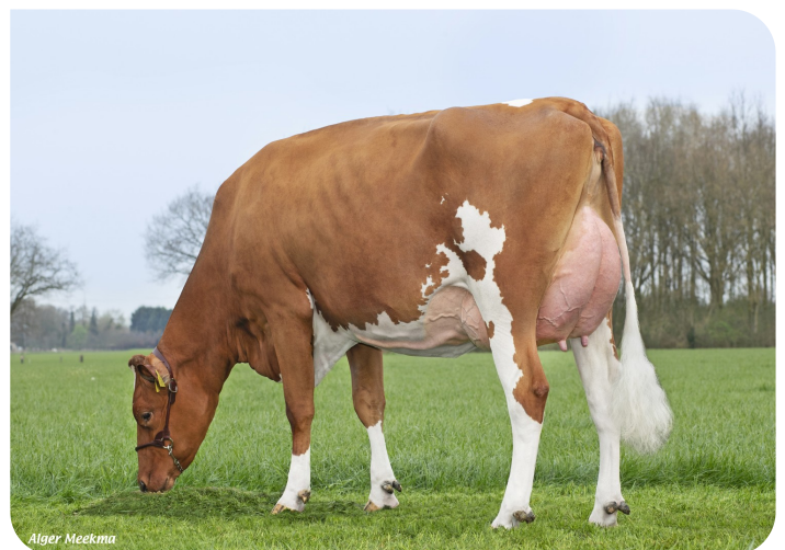
Grashoek Nordika 25 (p. Dex) Prop.: Fok- en melkveebedrijf K.I. SAMEN B.V., Grashoek (NL)