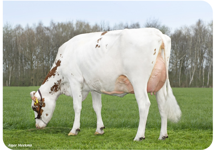
Grashoek Thrinicia 4 (p. Dex) Prop.: Fok- en melkveebedrijf K.I. SAMEN B.V., Grashoek (NL)