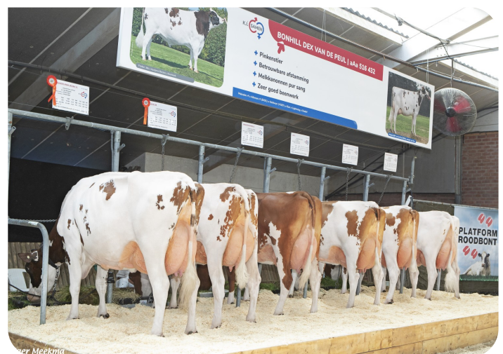
Groupe de filles de Dex van de Peul Nationale Roodbont Show 2024, Mariënheem (NL)