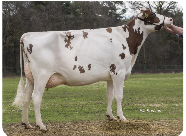
Massia 9857 van de Peul (EX91) (mère de Dex)