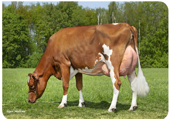
Grashoek Nordika 25 (p. Dex) Prop.: Fok- en melkveebedrijf K.I. SAMEN B.V., Grashoek (NL)