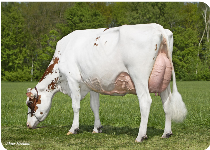
Grashoek Thrincia 4 (p. Dex) Prop.: Fok- en melkveebedrijf K.I. SAMEN B.V., Grashoek (NL)