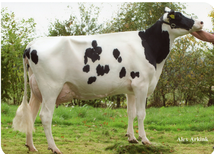
Massia 9397 RF van de Peul (VG 87) (grand-mère de Dex)