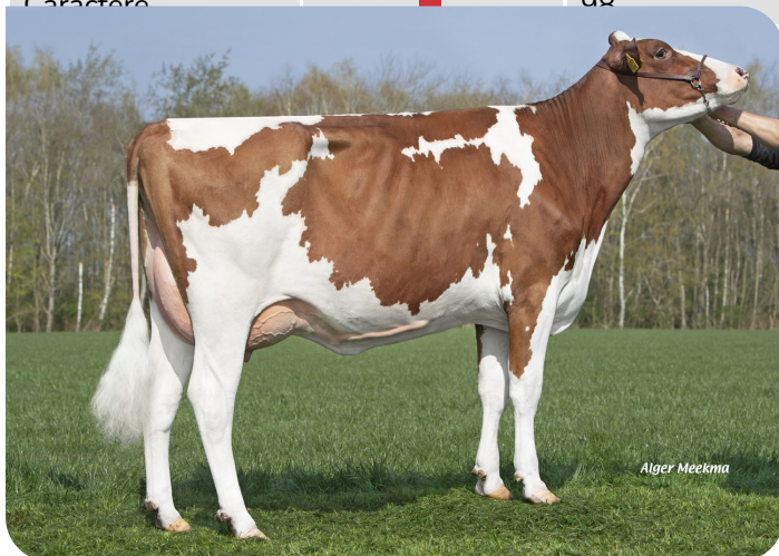
Glinzer Jettie 237 (VG 89)(p. Red Max) Prop.: Fok- en melkveebedrijf K.I. Samen B.V., Grashoek(NL)