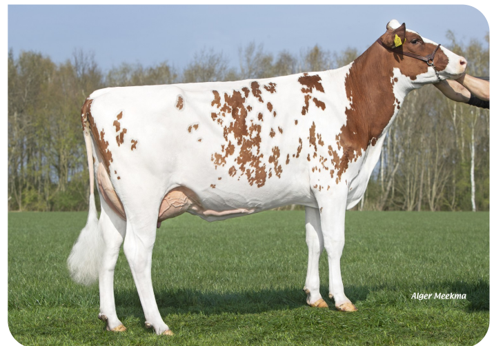
Glinzer Gerie 222 (p. Red Max) Prop.: Fok- en melkveebedrijf K.I. Samen B.V., Grashoek (NL)