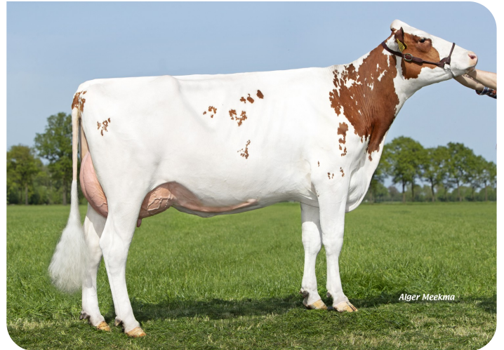
Grashoek Beatrix 177 (p. Magician RF)

Prop.: Verburg-de Groot V.O.F., Reeuwijk (NL)