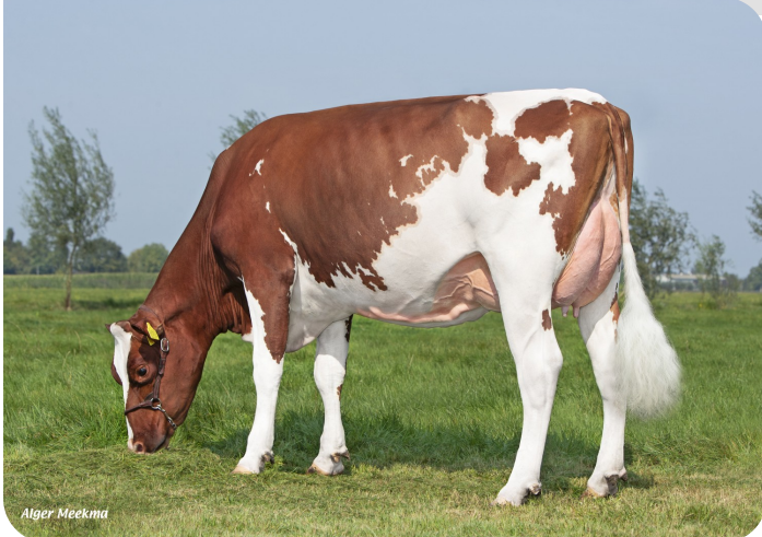
Neeltje 23 (p. Magician RF)