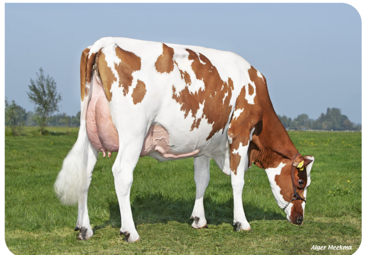
Emma 273 (p. Magician RF)

Prop.: Verburg-de Groot V.O.F., Reeuwijk (NL)