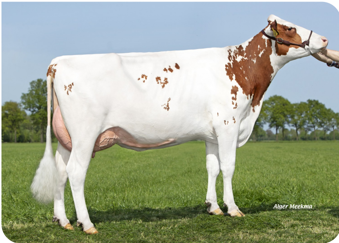
Grashoek Beatrix 177 (p. Magician RF) Prop.: Fok- en melkveebedrijf K.I. Samen B.V., Grashoek (NL)