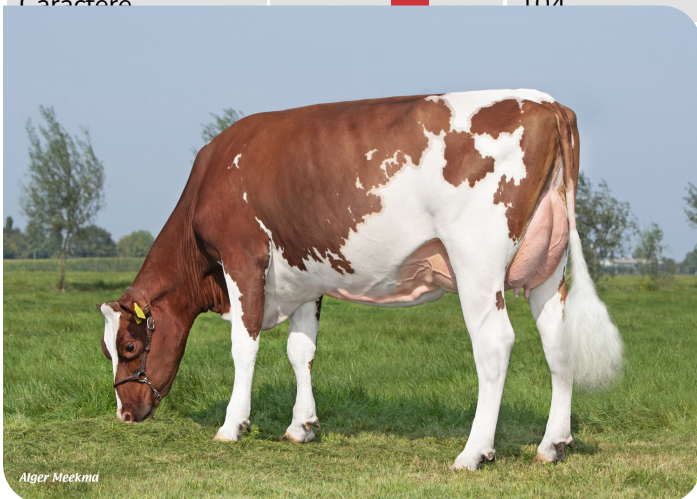
Neeltje 23 (p. Magician RF)