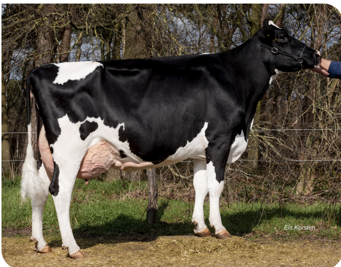
Delta Madame 6 (VG 87) Mère de Magician RF