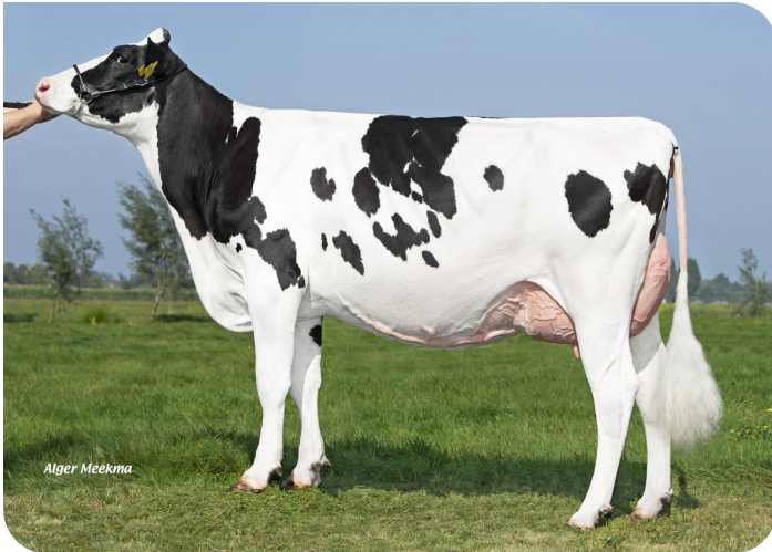
Leentje 3 (p. Magician RF)

Prop.: Verburg-de Groot V.O.F., Reeuwijk (NL)