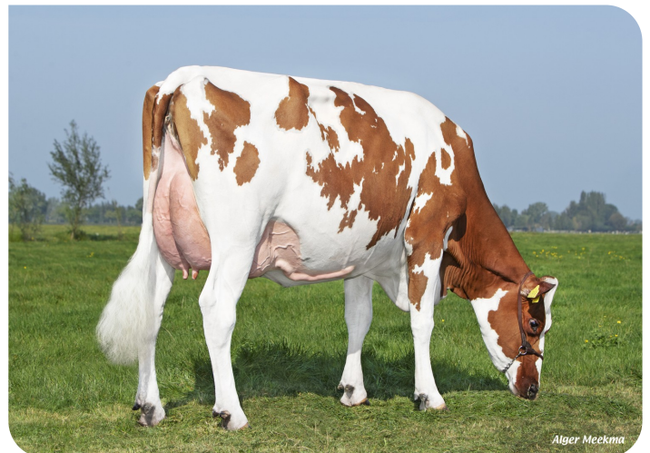
Emma 273 (p. Magician RF)

Prop.: Verburg-de Groot V.O.F., Reeuwijk (NL)