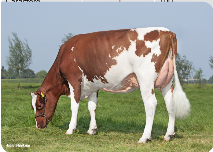
Neeltje 23 (p. Magician RF)