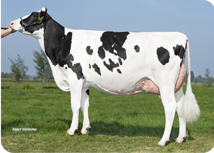
Leentje 3 (p. Magician RF) Prop.: Verburg-de Groot V.O.F., Reeuwijk (NL)