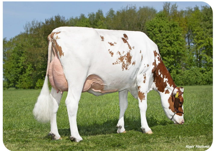
Grashoek Elsje 73 (p. Magician) Prop.: Fok- en melkveebedrijf K.I. Samen B.V. (NL)