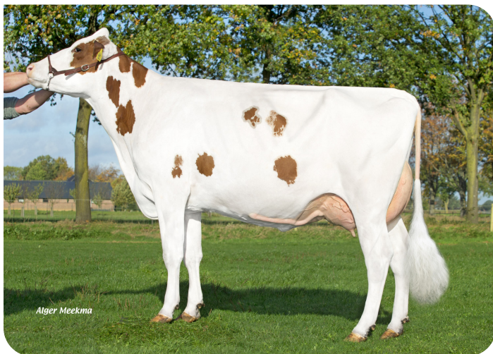
Liza 410 (p. Red River) Prop.: Agri-Services Fokmelkveebedrijf Frencken, Reuver (NL)