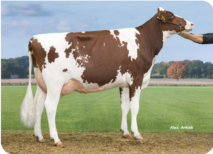
Huntje Anemoon 117 (VG 86) (mère de Red River)