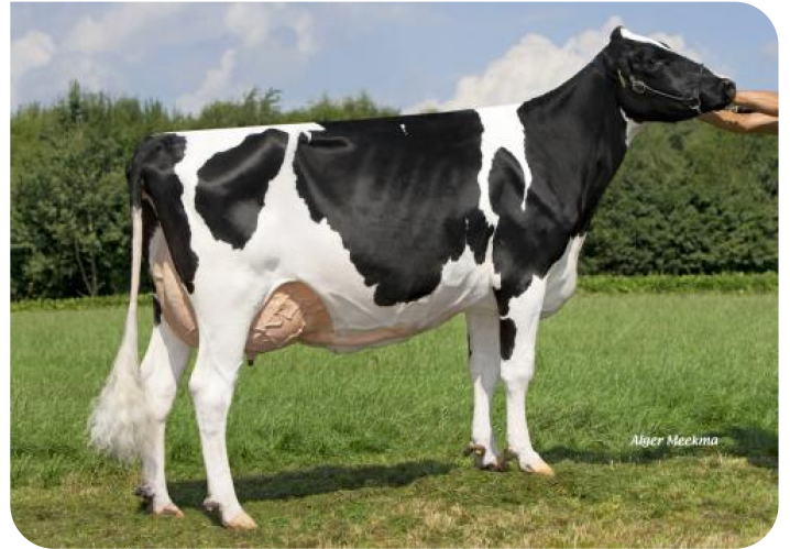
Grashoek Nel 118 Pp (p. Timeless (Pp)) Prop.: Melkveebedrijf Grashoek b.v., Grashoek (NL)