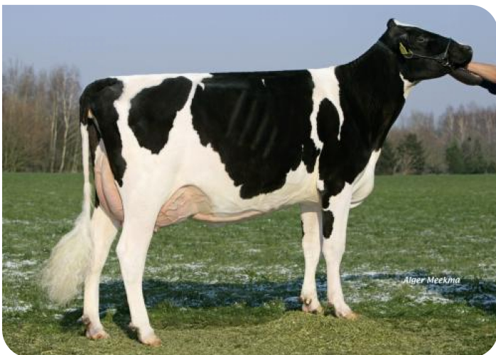
Grashoek Nel 118 Pp (VG 87) (p. Timeless (Pp)) Prop.: Melkveebedrijf Engelen v.o.f., Grashoek (NL)