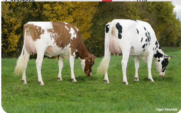
Grash. Corrie 520 (VG88) & Grash. Silke 130 (VG88) (p. Timeless (Pp)) Prop.: Melkveebedrijf Grashoek b.v., Grashoek (NL)