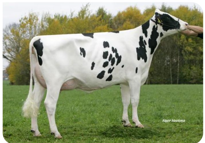
Grashoek Silke 130 (VG 88) (p. Timeless (Pp)) Prop.: Melkveebedrijf Grashoek b.v., Grashoek (NL)