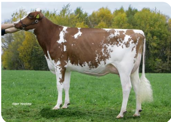
Grashoek Corrie 520 (VG 88) (p. Timeless (Pp)) Prop.: Melkveebedrijf Grashoek b.v., Grashoek (NL)