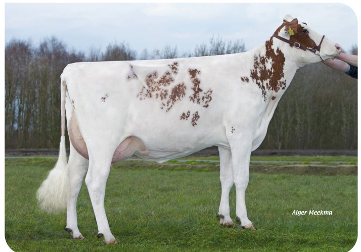
Grashoek Rita 16 (p. Timeless (Pp)) Prop.: Melkveebedrijf Grashoek b.v., Grashoek (NL)