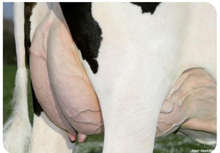
Mamelle de Grashoek Nel 118 Pp (p. Timeless (Pp)) Prop.: Melkveebedrijf Engelen v.o.f., Grashoek (NL)