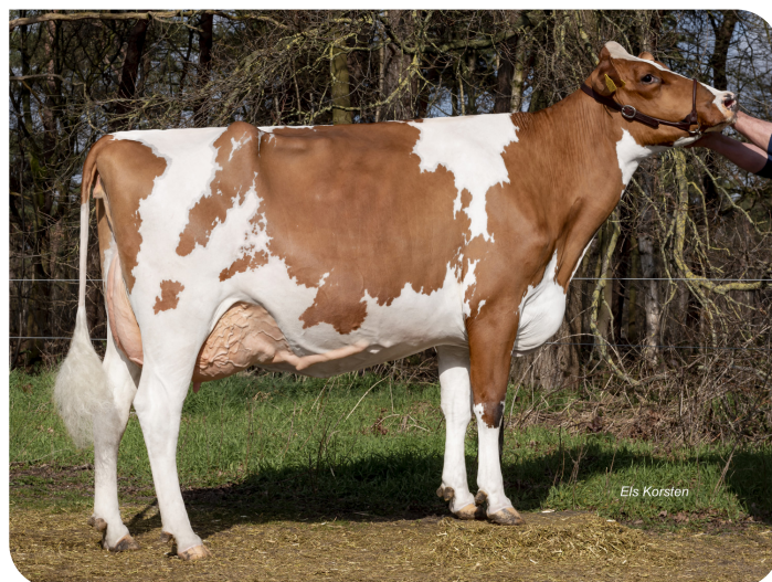
Grashoek Bobbie 97 Pp (EX91) (p. Timeless Pp) Prop.: Melkveebedrijf Grashoek bv, Grashoek