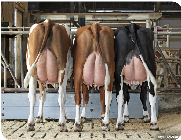
Les trois filles de Poppe Kayne Prop.: Mts. Eiting, Rekken (NL)