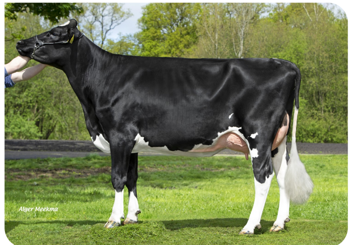
Diekers 3Star Ka Ida 3 (p. Kayne)