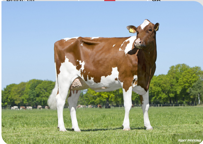
Red Rocks Massia 155 (VG 86) (mère de Celebration) Prop.: Melkveebedrijf Wesselink VOF, Beilen