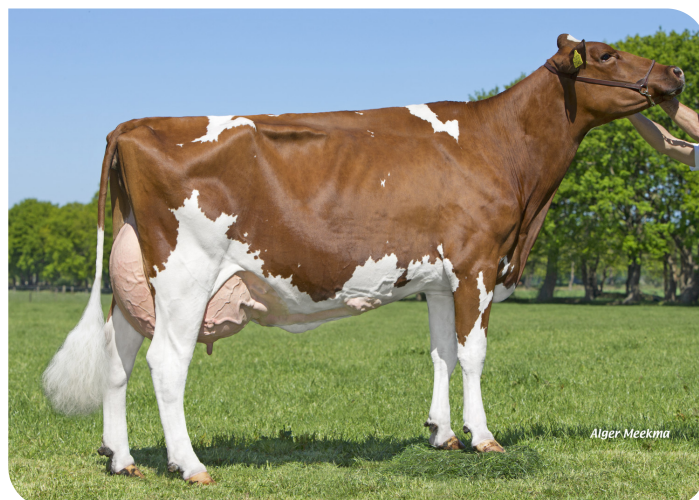
Red Rocks Massia 128 (VG 86) (grand-mère de Celebration) Prop.: Melkveebedrijf Wesselink VOF, Beilen