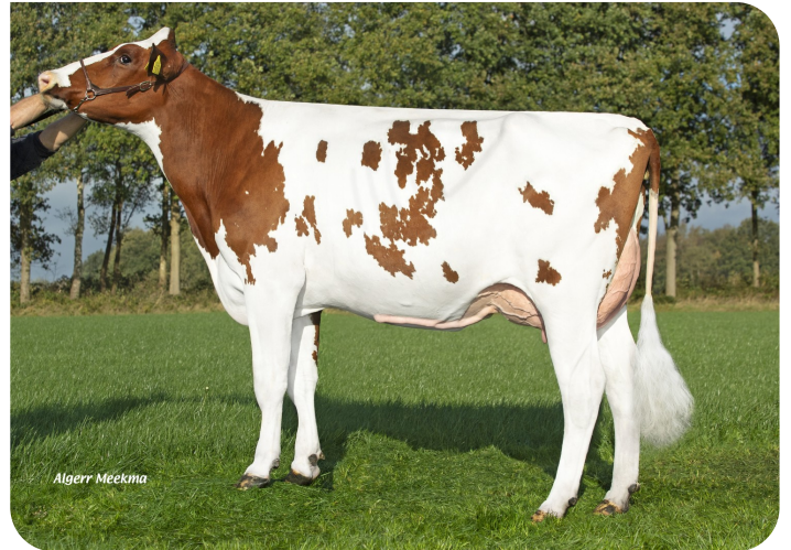
Red Rocks Massia 216 P (VG 87)

Prop.: Melkveebedrijf Wesselink VOF, Beilen (NL)