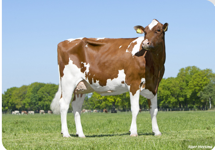
Red Rocks Massia 155 (VG 86) (mère de Celebration) Prop.: Melkveebedrijf Wesselink VOF, Beilen