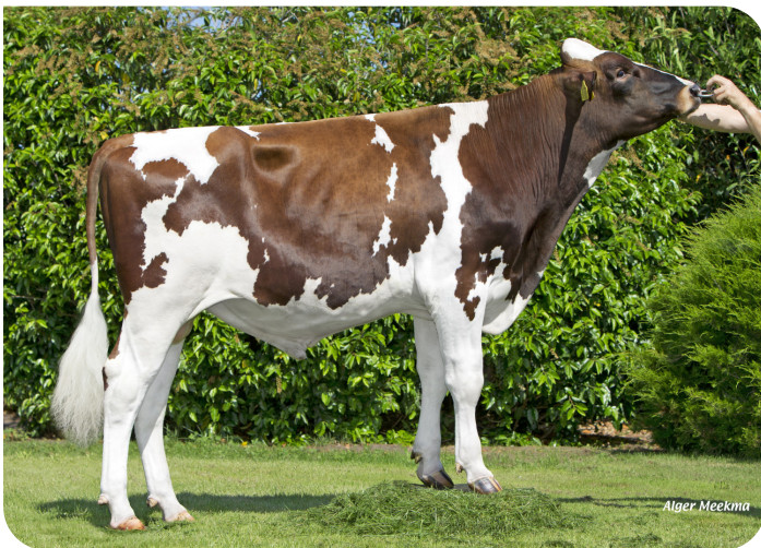
Red Rocks Celebration