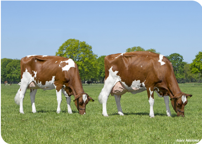
Red Rocks Massia 155 (VG 86) & Red Rocks Massia 128 (VG 86)