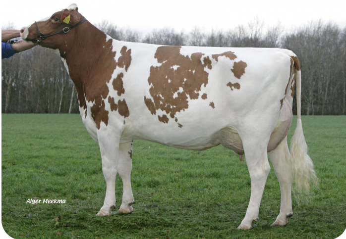
Irma 28 (p. Norwin rf) Prop.: V.O.F. Gebleektendijk, Nederweert-Eind (NL)