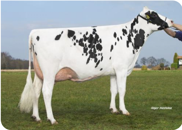
Grashoek Angel 51 (p. Norwin rf) Prop.: Melkveebedrijf Grashoek b.v., Grashoek (NL)