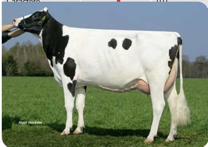
Everett 3 (VG 86) (p. Norwin rf) Prop.: Melkveehouderij Verwielen v.o.f., Hunsel (NL)