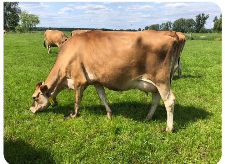
Cette fille de Napoleon (PP) Prop.: Ags. Bar. Urstromtal mbH & CoKG