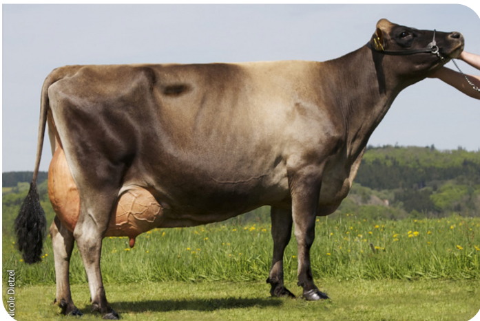
Scholz Evita (PP) (EX 91) mère de Napoleon PP