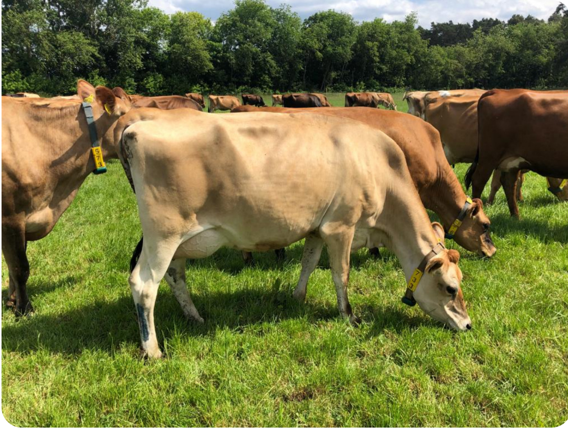
Cette fille de Napoleon (PP)