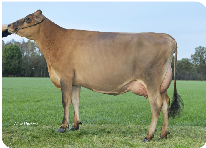
Grashoek Roza 178 (p. Napoleon PP)

Prop.: Fok- en melkveebedrijf K.I. Samen B.V., Grashoek (NL)