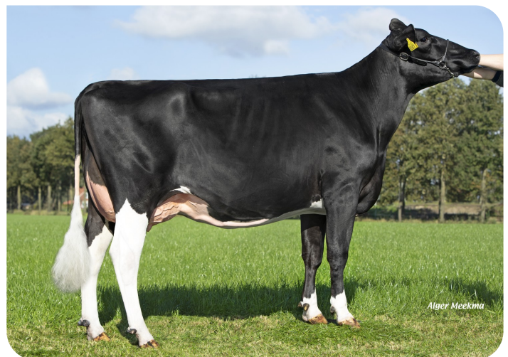
Marianne 358 (p. Tobor) Prop.: Te Voortwis C.V., Winterswijk-Miste (NL)