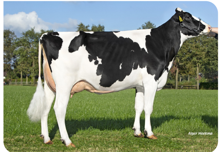
Marianne 361 (p. Tobor) Prop.: Te Voortwis C.V., Winterswijk-Miste (NL)