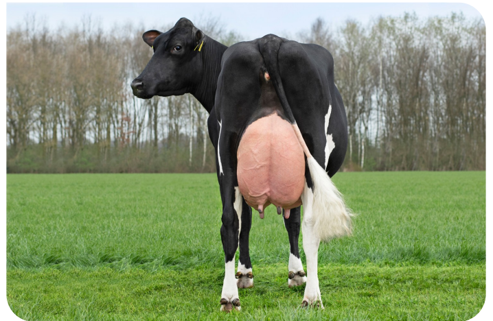
Grashoek Janna 156 (VG 85) (p. Tobor) Prop.: Melkveebedrijf Grashoek b.v., Grashoek (NL)