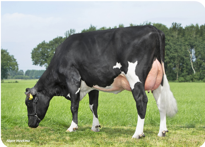
Grashoek Janna 156 (VG 85) (p. Tobor) Prop.: Melkveebedrijf Grashoek b.v., Grashoek (NL)