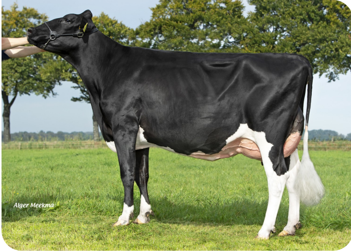
Thea 271 (p. Tobor) Prop.: VOF Melkveebedrijf Waterink, Beerzerveld (NL)