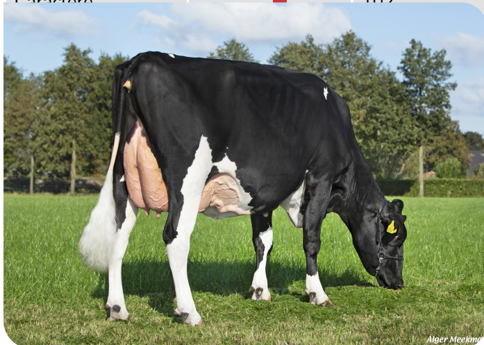
Marianne 359 (p. Tobor) Prop.: Te Voortwis C.V., Winterswijk-Miste (NL)