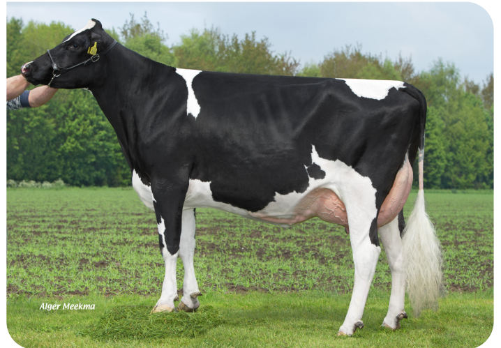
Grashoek Frida 81 (p. Ashburton) Prop.: Melkveebedrijf Grashoek b.v., Grashoek (NL)