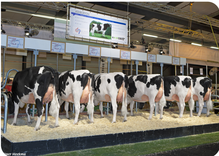
Les filles de Ashburton Hardenberg 2017