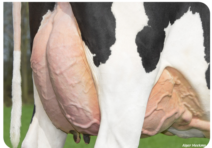
Mamelle de Maaike 360 (p. Ashburton) Prop.: Vreba Melkvee B.V., Vredepeel (NL)