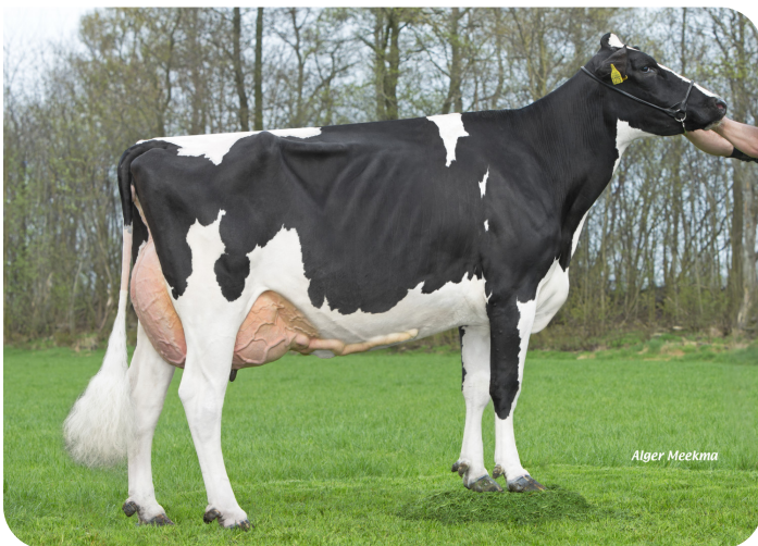
Maaike 360 (p. Ashburton) Prop.: Vreba Melkvee B.V., Vredepeel (NL)

2.00 317jrs 10702kg 4.42% 3.51% 3.00 333jrs 11154kg 4.88% 3.83% 4.00 299jrs 10785kg 4.96% 3.79% 5.00 338jrs 15122kg 4.66% 3.55% 6.01 373jrs 17976kg 4.74% 3.62% 7.05 358jrs 17387kg 4.55% 3.45% 8.07 427jrs 14288kg 5.43% 3.71% 91 90 89 EX 90