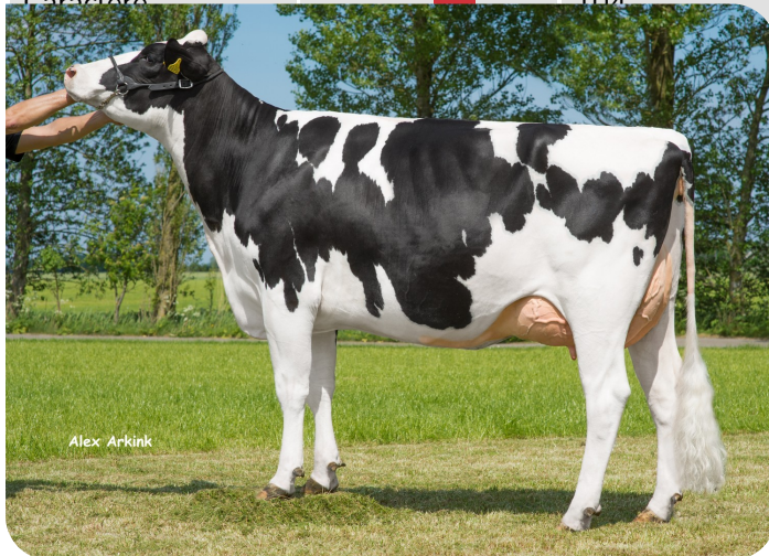
Skalsumer Pietje 981 Grand-mère de Paw Patrol