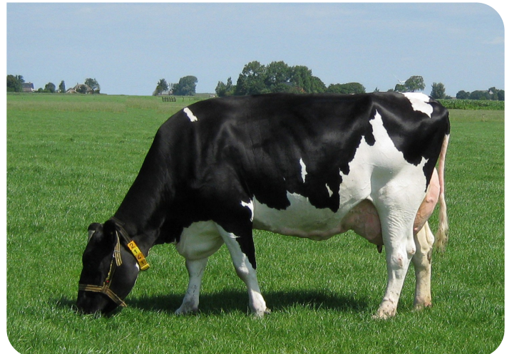
Skalsumer Pietje 736 Arrière-arrière grand-mère de Paw Patrol