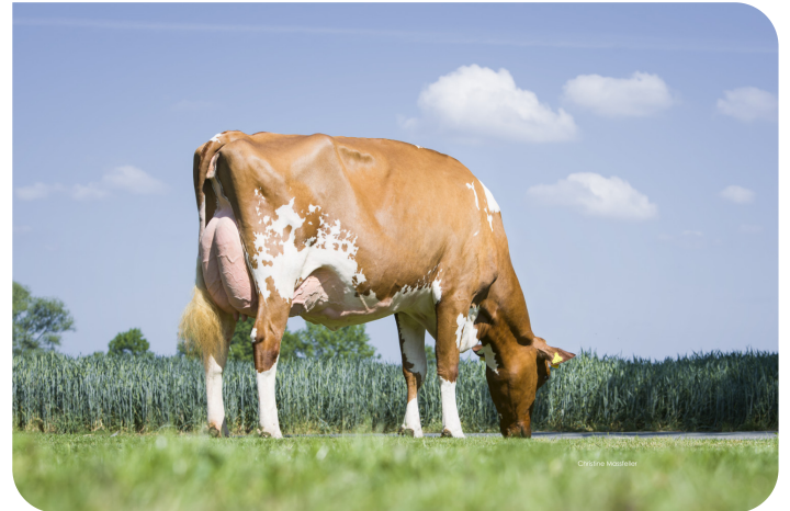
WR Miley (EX 91) Mère de Centrum