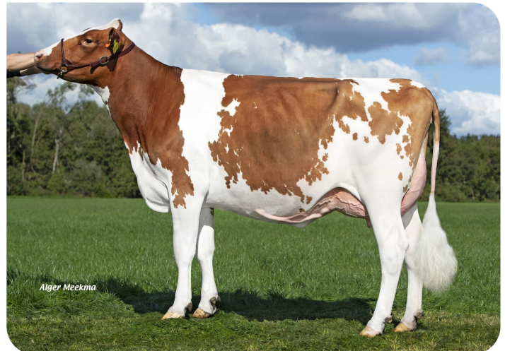
Grashoek Groliena 43 (p. Centrum) Prop.: Fok- en melkveebedrijf K.I. Samen B.V., Grashoek (NL)