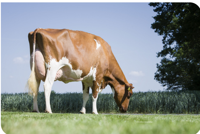
WR Monroe (EX 90) Grand-mère de Centrum