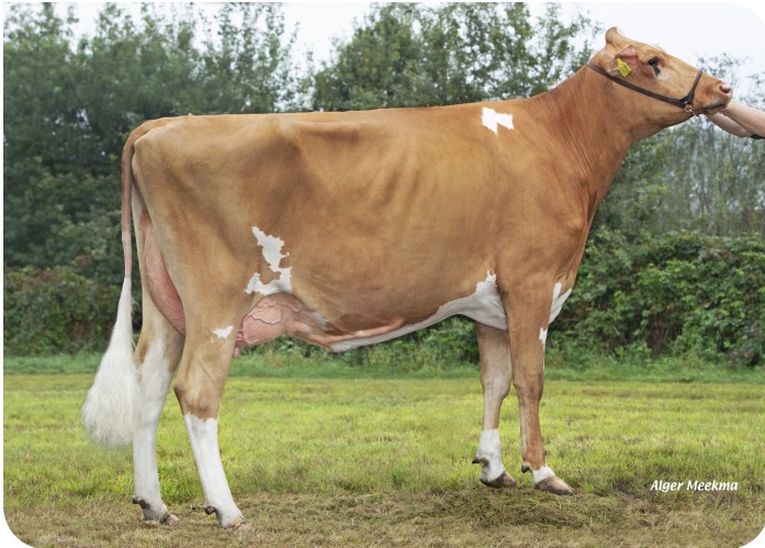
Lian 482 (p. Centrum) Prop.: V.O.F. van Mensvoort, Berkel-Enschot (NL)