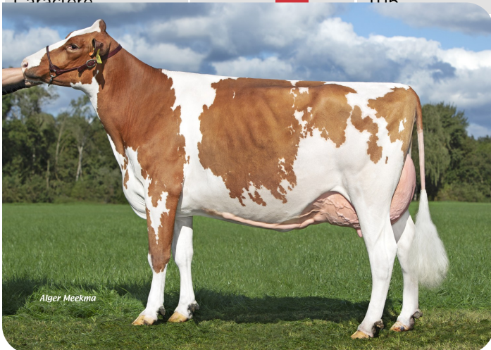
Grashoek Julia 123 (p. Centrum)

Prop.: Fok- en melkveebedrijf K.I. Samen B.V., Grashoek (NL)